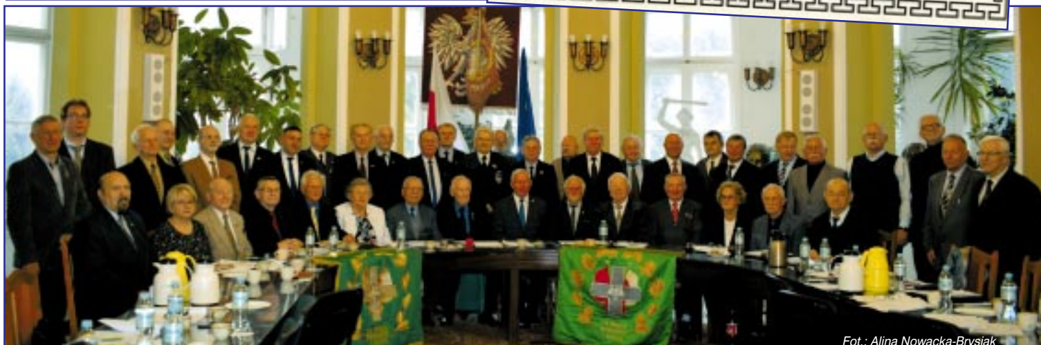
Fot.: Alina Nowacka-Brysiak