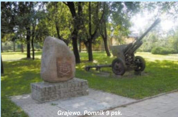
Grajewo. Pomnik 9 psk.

waliśmy do oficerskich obozów jeńców, a więc do oflagów, a nie do stalagów.