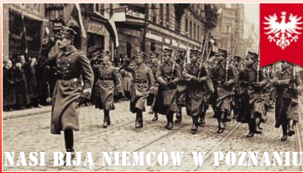
NASI BIJĄ NIEMCÓW W POZNANIU